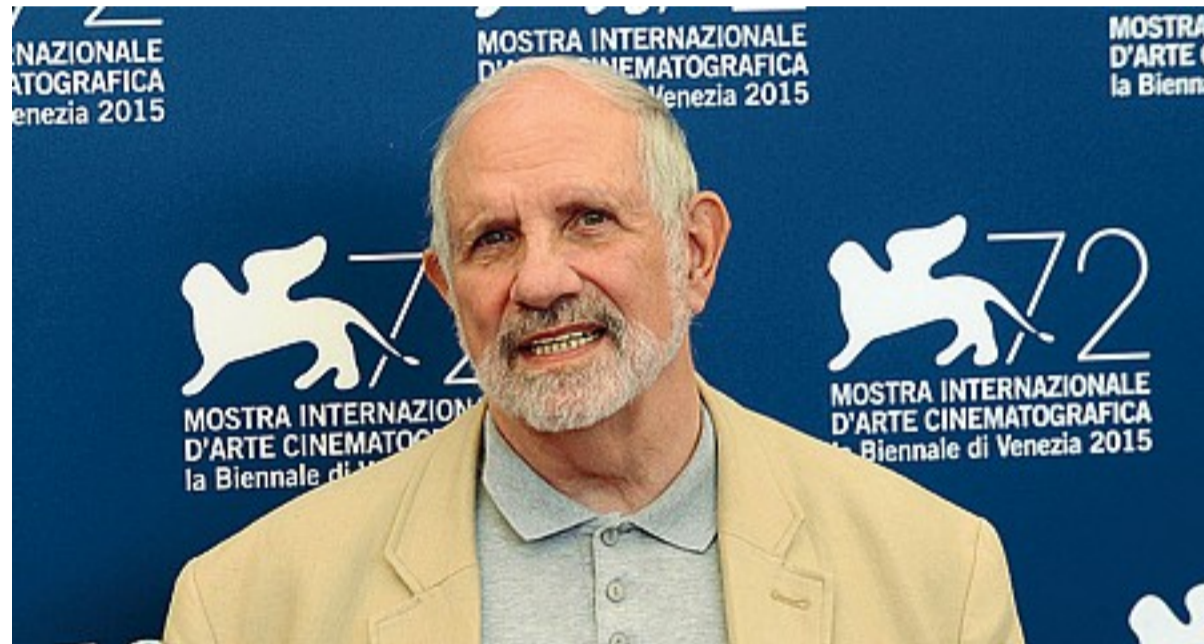
«Una giornata assieme» Brian De Palma alla Mostra del Cinema. Sotto, il musicista veneziano Pino Donaggio

Non è un caso che nei 110 minuti della versione finale, sintesi di quasi 40 ore di registrazione in cui De Palma racconta la